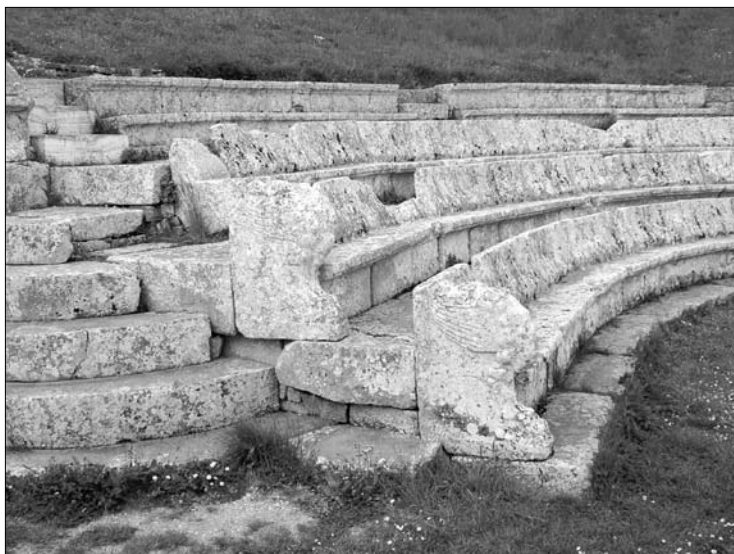
8. Pietrabbondante. Teatr – najniższe rzędy widowni z bocznymi oparciami w kształcie uskrzydłych łap gryfa.