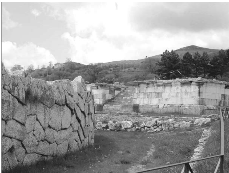
6. Pietrabbondante. Podium świątyni B od strony frontowej; na pierwszym planie tylny mur widowni w opus polygonale .

Modernizując miasta, osiedla i miejsca kultu, Italikowie korzystali przede wszystkim z wzorców hellenistycznych zasymilowanych na Półwyspie Apenińskim, zwłaszcza w Wielkiej Grecji i w Kampanii, oraz z modeli rzymskich i lатыńskich. Rola Kampanii jako regionu przodującego pod względem zarówno gospodarczym, jak i artystycznym w II wieku p.n.e. jest niezaprzeczalna, podobnie jak jej głęboki wpływ na kulturę ludów Samnium. Jest więc dość prawdopodobne, że rozbudowę samnickiego sanktuarium powierzono kampańskim architektom i budowniczym. Wskazywać na to mogą między innymi uderzające podobieństwa między teatrem w Pietrabbondante a teatrami w Pompejach, choć należy pamiętać, że teatry pompejańskie stanowią punkt odniesienia dla innych budowli teatralnych Italii przede wszystkim ze względu na swój wyjątkowy stan zachowania i powinny być traktowane jedynie jako przykłady pewnego etapu rozwoju teatru italskiego.