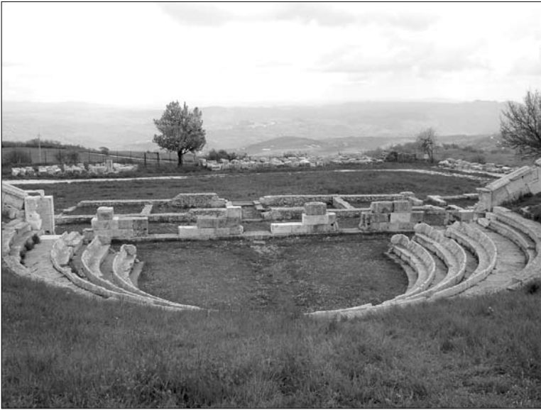
5. Pietrabbondante. Teatr – widok sprzed podium świątyni B. Fot. autorka

sojuszników. Pentrowie, zmuszeni przez Rzymian do kapitulacji jak inne plemiona samnickie, przyjęli wówczas status rzymskich sprzymierzeńców.