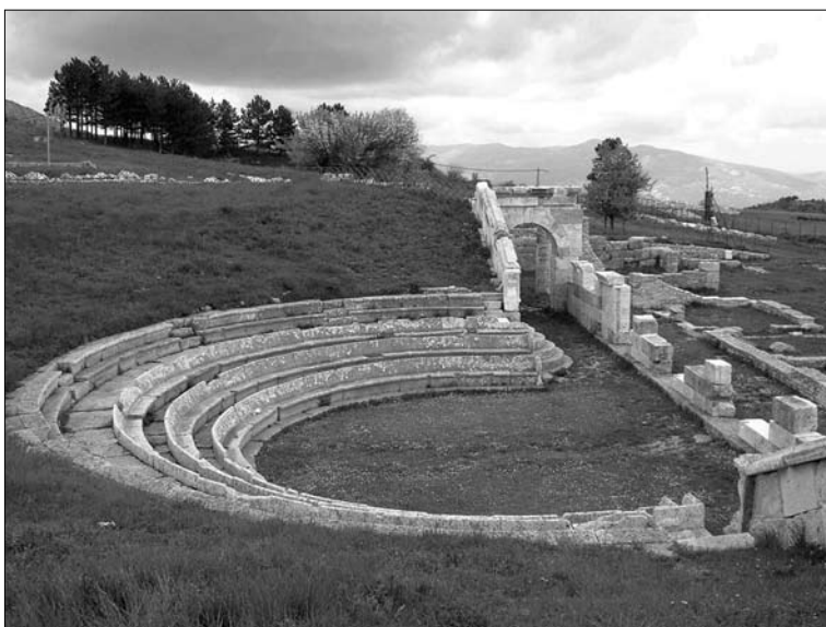
4. Pietrabbondante. Teatr.

miejscowość tę odwiedził między innymi Theodor Mommsen. W wyniku prac archeologicznych, rozpoczętych w roku 1857 pod patronatem władz w Neapolu 18 i trwających do okresu walk o zjednoczenie Italii, a następnie na krótko podjętych pod koniec stulecia, odsłonięto mniejszą świątynię (A) i teatr. Systematyczne wykopaliska na większą skalę wznowiono dopiero w roku 1959. Powierzono je archeologowi Adrianowi La Regina, ówczesnemu inspektorowi w Zarządzie do spraw Starożytności Regionu Abruzzo i Molise ( Soprintendenza alle Antichità dell’Abruzzo e Molise ) w Chieti, późniejszemu autorowi licznych prac i artykułów z dziedziny archeologii i historii Samnium 19 . Owocem prac prowadzonych pod jego kierunkiem było przede wszystkim odsłonięcie drugiej, większej świątyni (B).