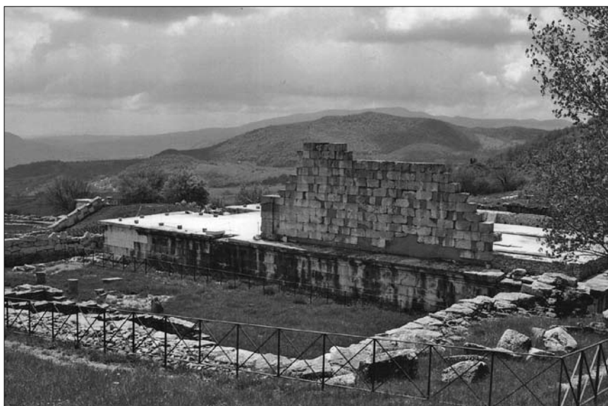
3. Pietrabbondante. Świątynia B – zachowane podium i zrekonstruowany fragment ściany celli.

wano kult w każdej ze świątyń, badacze oznaczyli je konwencjonalnie literami: starszą, mniejszą i wcześniej odkrytą świątynię – literą A, budowlę okazalszą, powstałą w okresie późniejszym i później wydobytą na światło dzienne – literą B. Tym, co wyróżnia okręg sakralny w Pietrabbondante spośród innych miejsc kultu w Samnium, jest usytuowanie dwóch budowli – świątyni B i teatru – w jednym, zaprojektowanym jako całość zespole architektonicznym, którego układ nawiązuje do wzorców stosowanych w innych sanktuariach italskich oraz łatyńskich. Wyjątkowe walory takiego rozwiązania podkreślało malownicze, tarasowe położenie obu budowli – wyżej świątyni, niżej teatru – na łagodnie opadającym stoku, ponad drogą biegnącą u stóp sanktuarium.