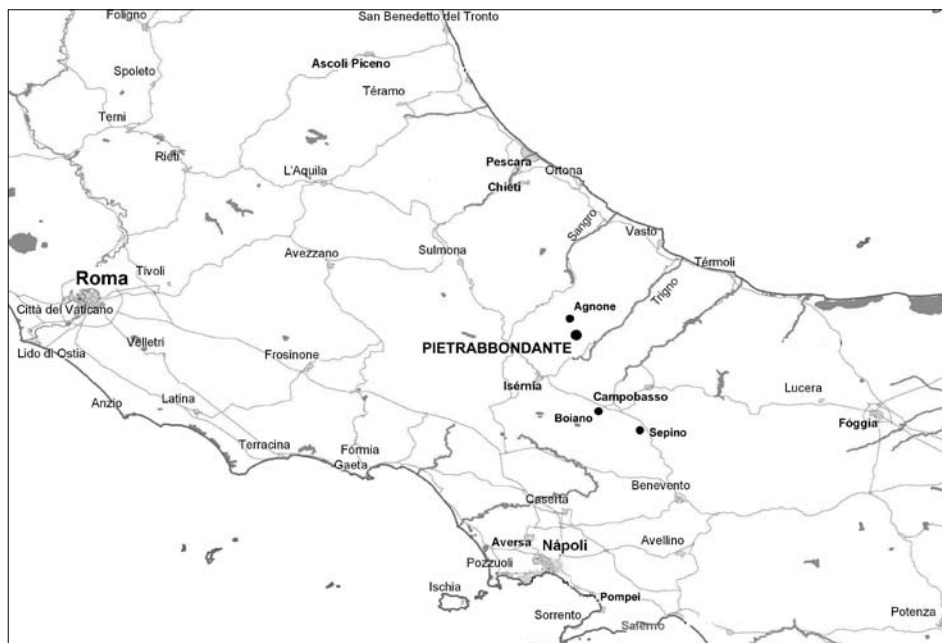
1. Orientacyjna mapka środkowej Italii – położenie Pietrabbondante

Kerres (Cerery) 4 , datowana na III lub II wiek p.n.e. W starożytności terytoria te zamieszkiwał samnicki lud Pentrów ( Pentri ).