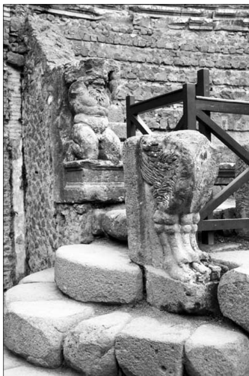
9. Pompeje. Odeon – dekoracje architektoniczne.