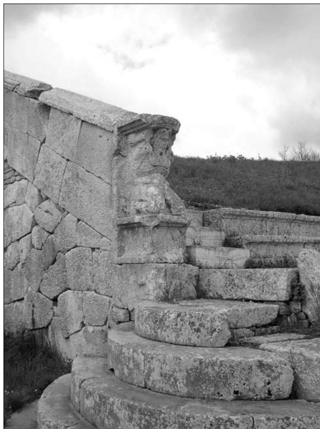
7. Pietrabbondante. Teatr – figura atlasa. Fot. autorka

Wielkiej Grecji i Sycylii zaczęły powstawać na obszarze południowej i środkowej Italii wcześniej niż w Lacjum. Ogromne opóźnienie samego Rzymu w tej dziedzinie w stosunku do reszty Italii wynikało stąd, że budowa stałych teatrów została tam w II wieku p.n.e. prawnie zakazana przez senat – jak się zdaje – ze względów przede wszystkim politycznych 43 . Pierwszy kamienny teatr wznosił w Rzymie dopiero Gnejusz Pompejusz Magnus; dedykacja tej budowli miała miejsce w 55 r. p.n.e.